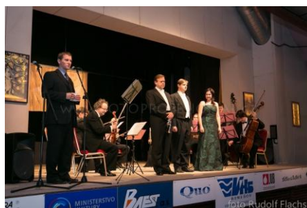
Podblanický podzim, úvodní slovo starosty

MěKS, potažmo město Říčany, je také jedním ze spolupořadatelů významného středočeského hudebního festivalu Podblanický podzim. Festival vznikl v roce 1984 na počest Jana Dismase Zelenky,