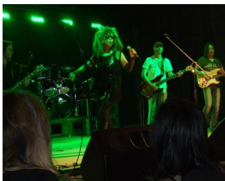
Silvestrovská show s „Tinou Turner“

Na závěr roku pořádalo MěKS také Silvestr s živou hudbou. Jednalo se o akci poprvé konanou v roce 2008, kterou chtělo MěKS přispět k prohloubení pocitu obyvatel, že se v Říčanech utěšeně rozvíjí kulturní i společenský život. Návštěvnost se od počátku pohybovala kolem 80 – 90 lidí a až do roku 2010 mírně rostla, což bylo nadějně a čekali jsme další rozvoj. V roce 2011 bohužel náhle a neočekávaně poklesla na 56 platících návštěvníků (i když všichni byli s dramaturgií večera, uměleckou a organizační úrovní a atraktivností pořadu velmi spokojeni). Zvažovali jsme tedy, zda tuto akci dále pořádat, nakonec jsme se rozhodli vyhovět přání stálých „věrných“ návštěvníků. Rozšířili jsme program o další účinkující (hrály 2 kapely, součástí