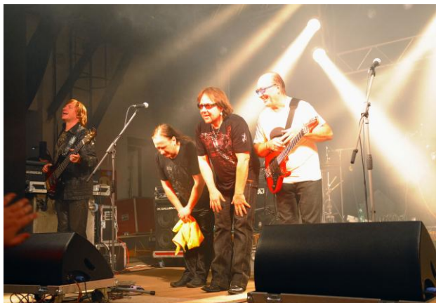
Olympic – 26.3.