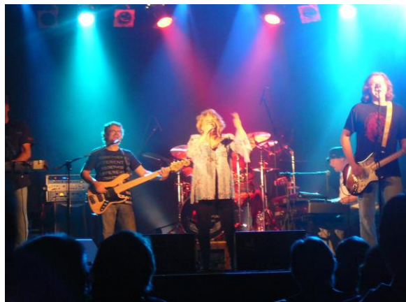
Věra Špinarová – 20.10.