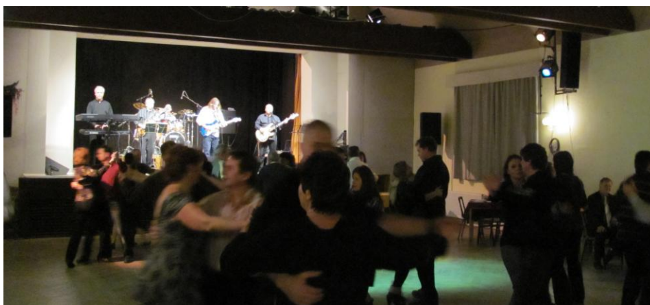
Silvestr – 31.12.