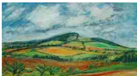
Z výstavy Karla Pokorného „Středočeská krajina v uměleckém díle“, pořádané u příležitosti hudebního festivalu Podblanický podzim

Příležitostně výtvarné či dokumentační není zařízením typu nemá ambice je suplovat. zejména předsálí. Bývají některé koncerty vážné obrazů), dokumentují organizací či jsou aktuálně příležitostech.